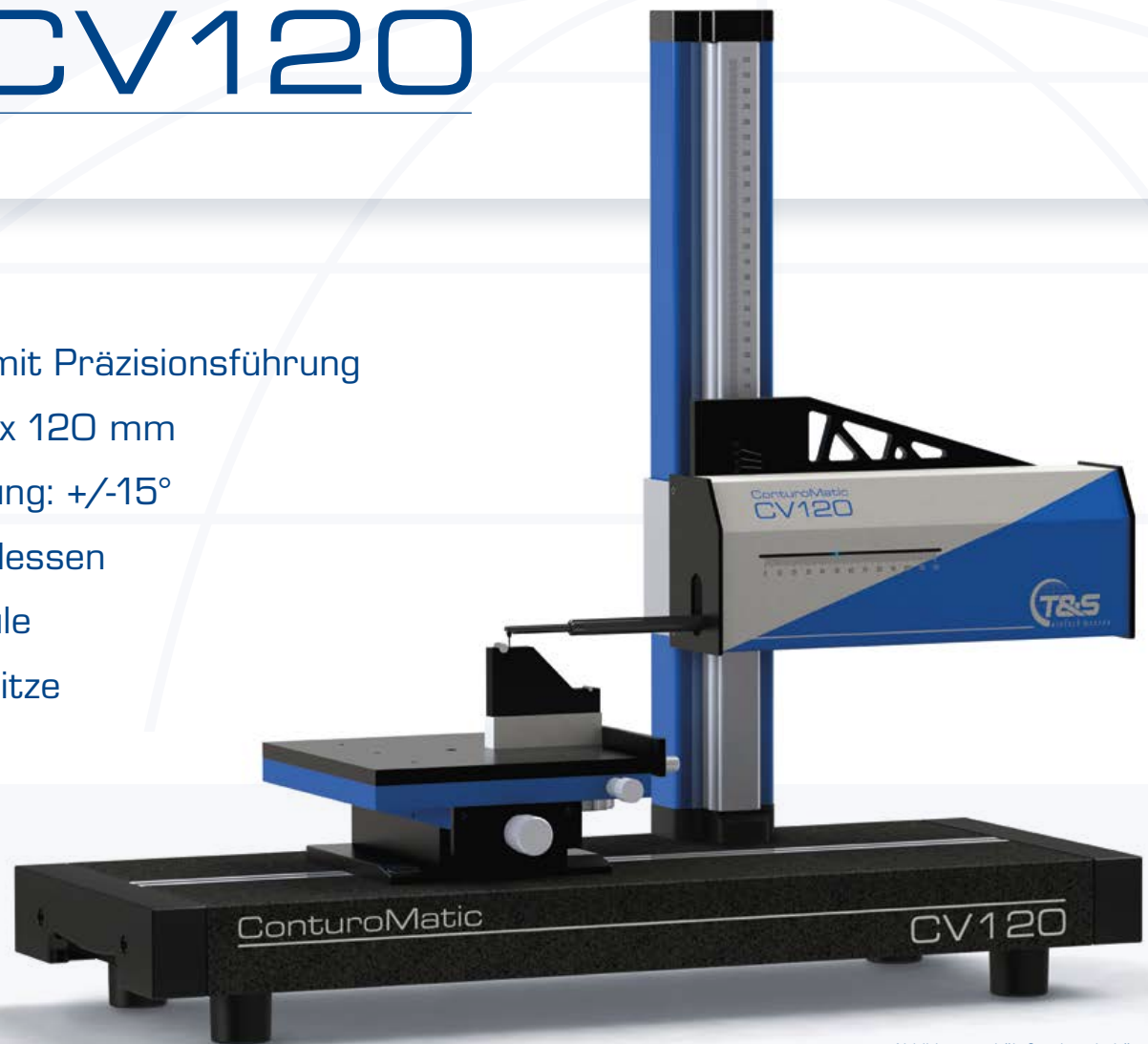
Abbildung enthält Sonderzubehör